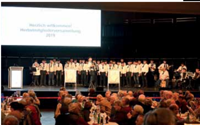
Der Shantychor „Hallerschipper“ sorgte bei seiner Premiere im Herbst für beste Stimmung (l.) An den Ständen unserer Kooperationspartner war der Andrang der Mitglieder groß (u.).