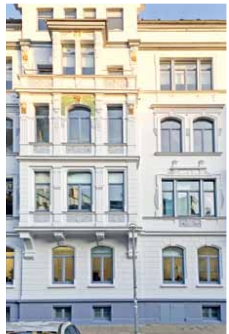
Der 2. Platz des Fassadenwettbewerbs 2019

Alle teilnehmenden Hauseigentümer hatten ihre Objekte mit viel Liebe zum Detail und mit großem Engagement verschönert. Wir freuen uns auf die glanzvollen Akzente, die uns der Fassadenwettbewerb im kommenden Jahr bringen wird.