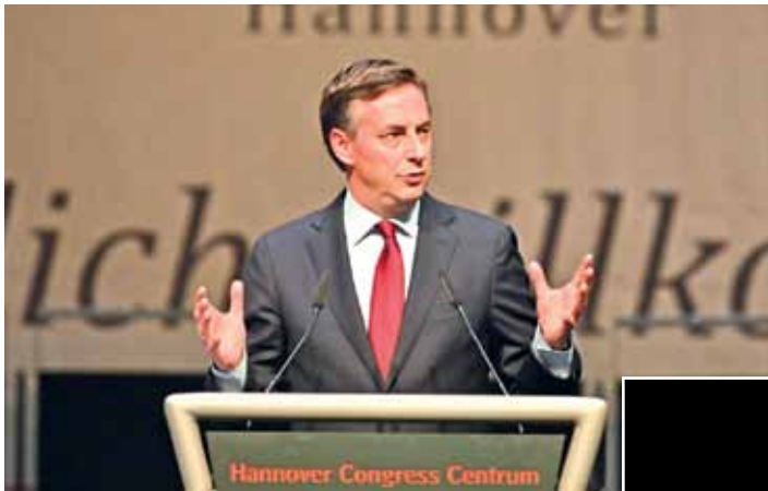
Europaabgeordneter und Ministerpräsident a.D. David McAllister hielt auf der Jahreshauptversammlung ein flammendes Plädoyer für ein starkes Europa.