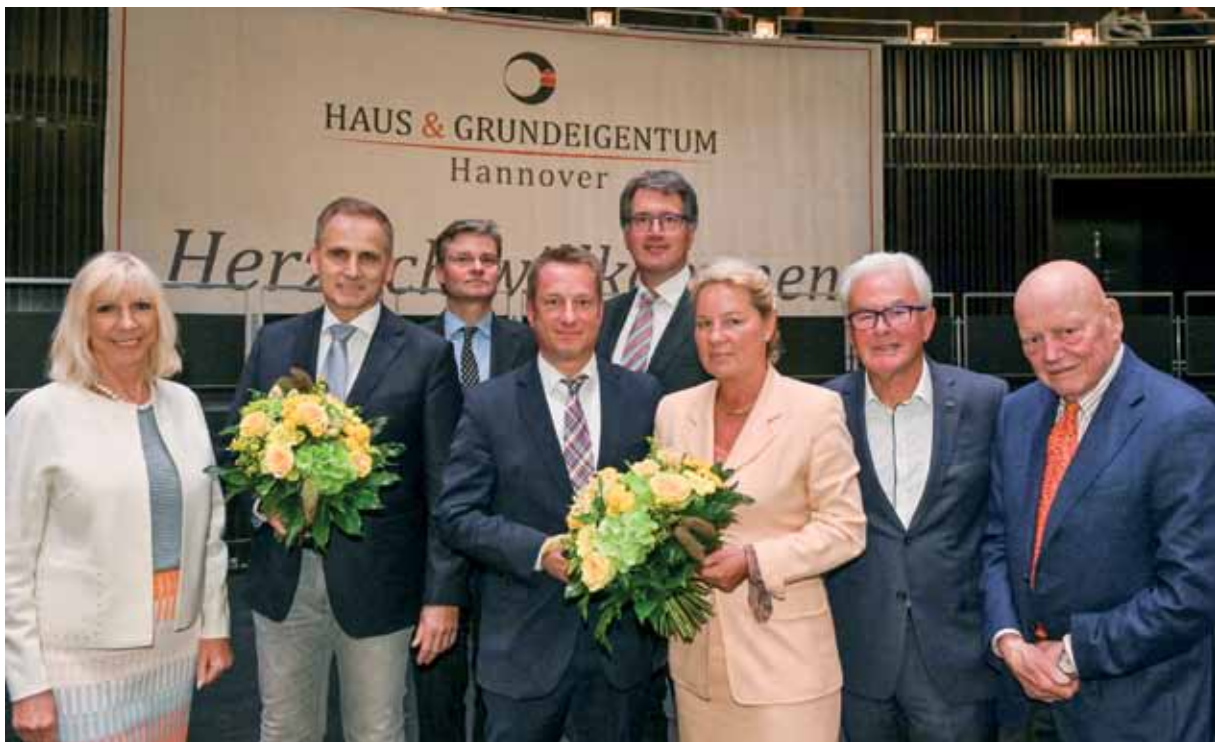
Vorstand von HAUS & GRUNDEIGENTUM Hannover (v.l.)