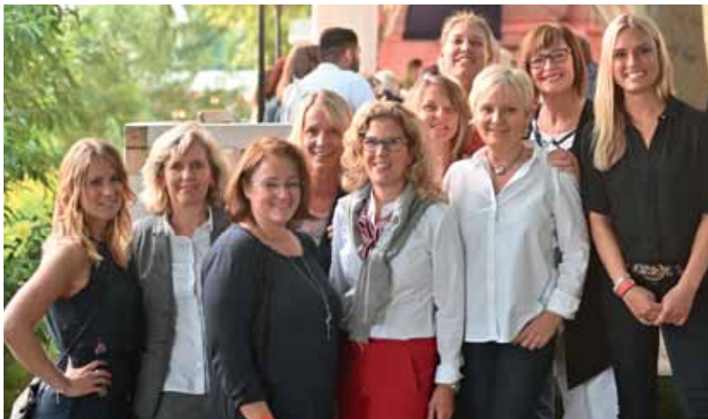
Sie sind eine wichtige Stütze des Vereins: Die Mitarbeiterinnen des Juristen-Sekretariats, des Service-Centers und der Abteilung Betriebskostenabrechnung.

Zusätzlich ergänzte ein umfangreiches Vortrags- und Seminarprogramm unser Dienstleistungsangebot. Wir freuen uns über einen Teilnahmerecord von 968 Mitgliedern, die die 13 Vortragsveranstaltungen besuchten und 223 Mitgliedern, die ihre Kenntnisse durch Teilnahme an 9 Seminarveranstaltungen erweiterten.