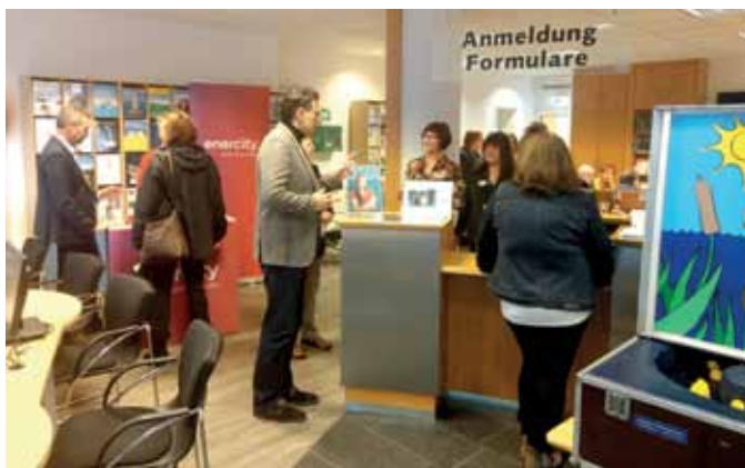
Viele Mitglieder und Besucher kamen beim Tag der offenen Tür ins Service-Center in der Theaterstraße.

Und was geboten wurde, schien vielen Gästen gefallen zu haben – gleich 19 Vereinseintritte konnten wir verzeichnen. Als Dank bekamen die Neu-Mitglieder an diesem Tag die Aufnahmegebühr von 50 Euro geschenkt. Stark in Anspruch genommen wurde aber auch die kostenlose Beratung durch unsere Experten in allen Fragen rund um die Immobilie.