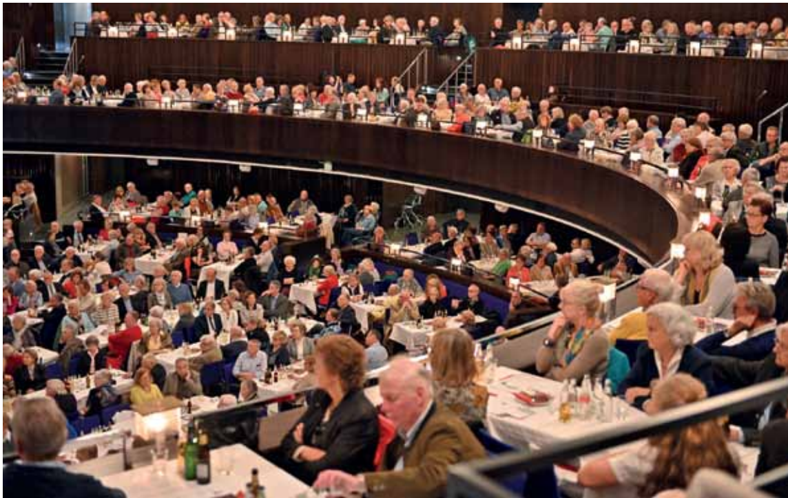
HAUS & GRUNDEIGENTUM – eine starke Gemeinschaft: Der Kuppelsaal im HCC war bei der Jahreshauptversammlung des Vereins traditionell bis auf den letzten Platz gefüllt.

Der von Politik und Medien verstärkt geführte Kreuzzug gegen private Haus-, Wohnungs- und Grundeigentümer, hat unsere Organisation, an der Spitze HAUS & GRUND Deutschland und HAUS & GRUND Niedersachsen, in nie dagewesener Weise auf den Plan gerufen und gefordert.