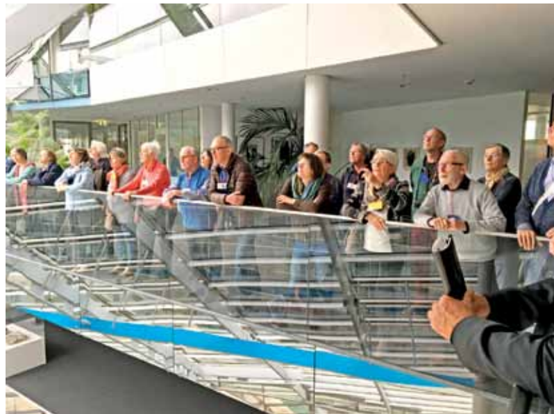
Das Verwaltungsgebäude der NORD/LB.

Gern besucht wurden auch die angebotenen Fachvorträge über Themen wie Datenschutz, Solarenergie, Trinkwasser in Hannover etc. und nicht zuletzt auch der erste PC-Spezialkurs.